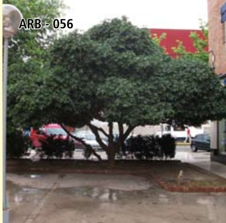
ARB - 056