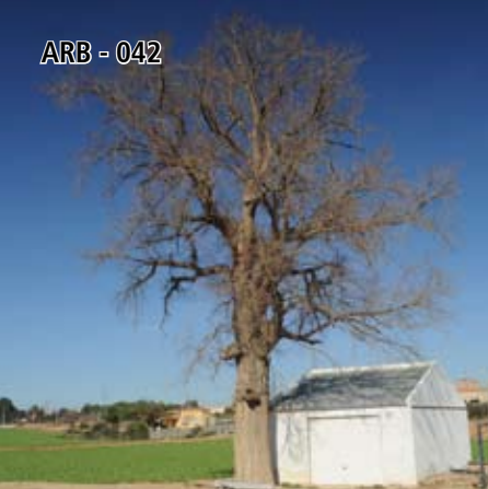
ARB - 042