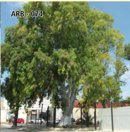
ARB - 074