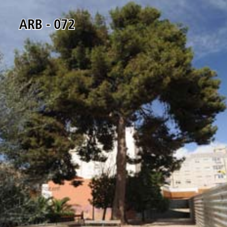
ARB - 072