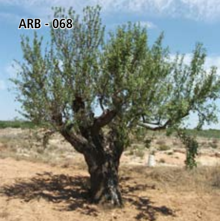
ARB - 068