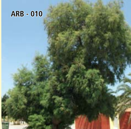
ARB - 010