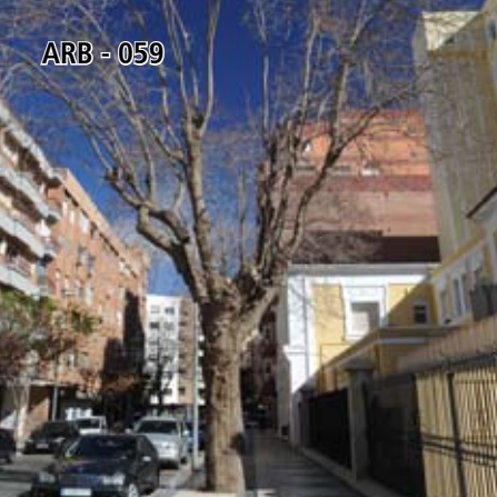
ARB - 059