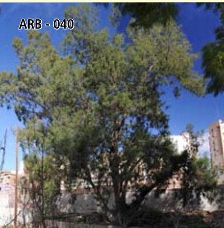
ARB - 040