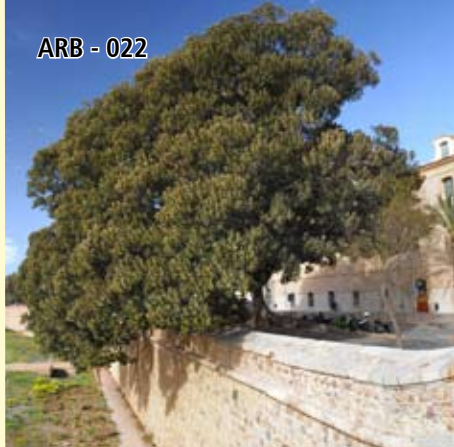
ARB - 022