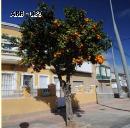
ARB - 039