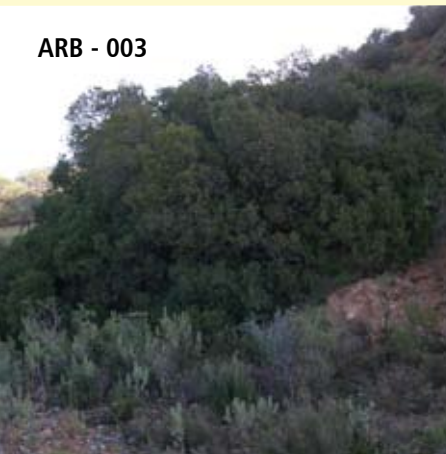
ARB - 003