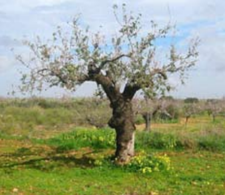
ARB - 034