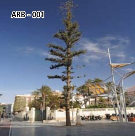
ARB - 001