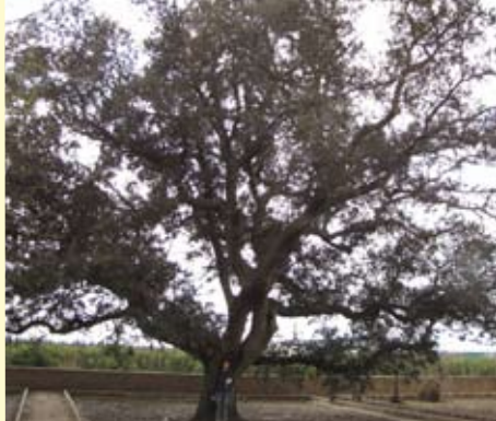
ARB - 035