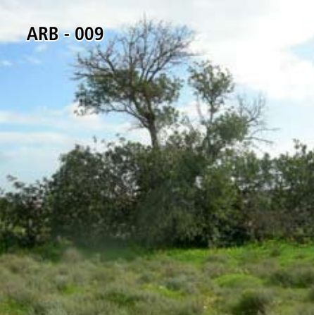
ARB - 009