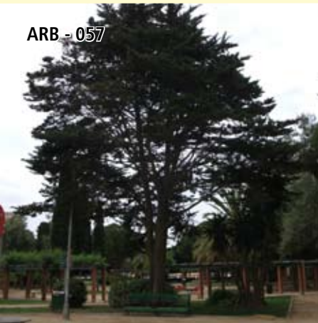
ARB - 057