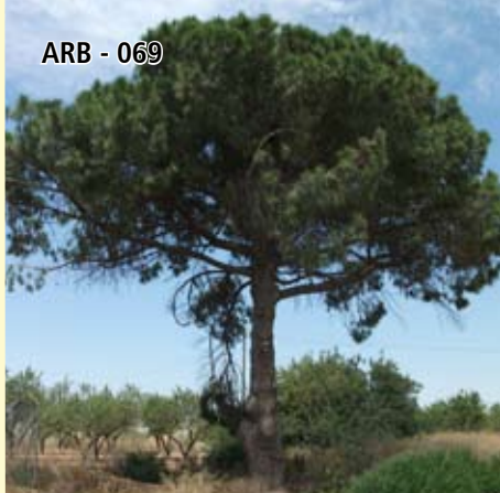
ARB - 069