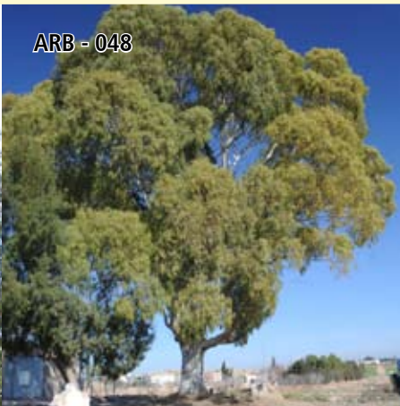
ARB - 048