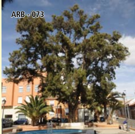
ARB - 073