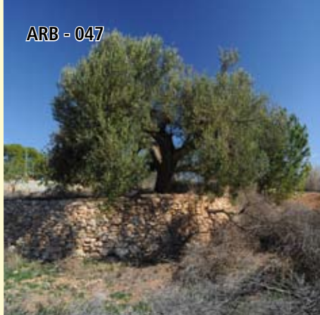
ARB - 047