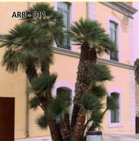
ARB - 011