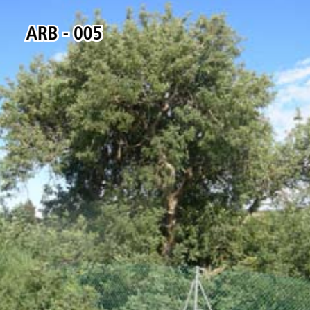
ARB - 005