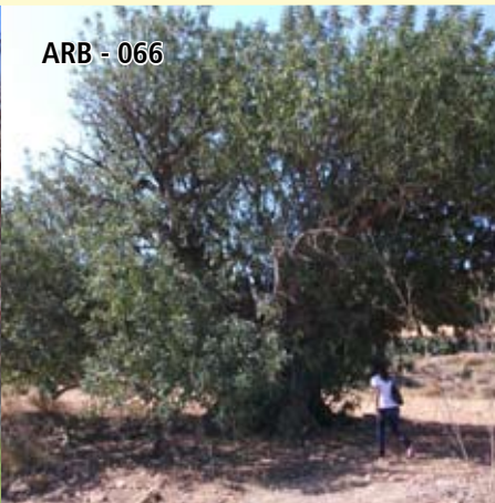
ARB - 066