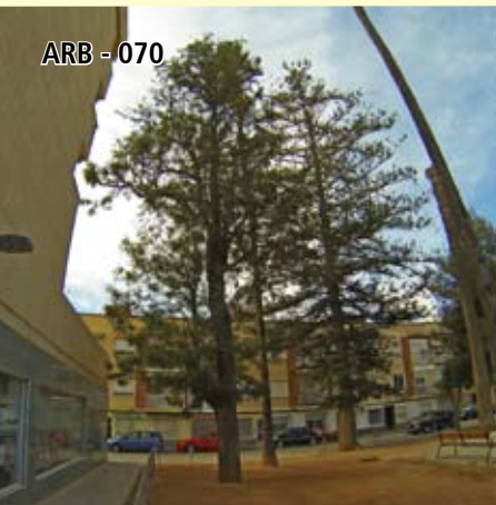
ARB - 070