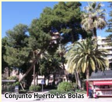
Conjunto Huerto Las Bolas

CON-001 Conjunto Huerto Las Bolas CON-002 Conjunto Plaza de La Merced