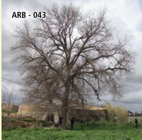
ARB - 043