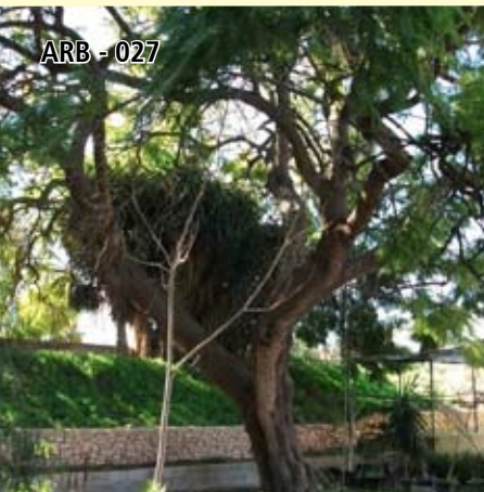
ARB - 027