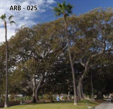
ARB - 025