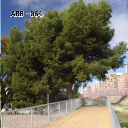
ARB - 064