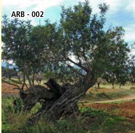
ARB - 002