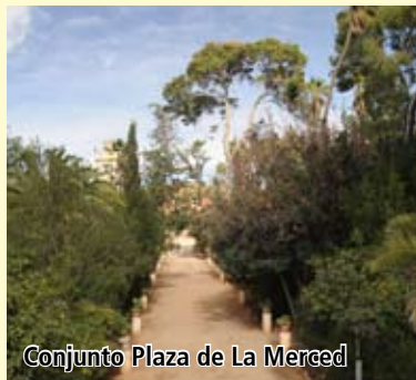
Conjunto Plaza de La Merced