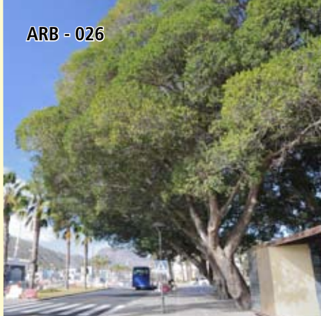
ARB - 026