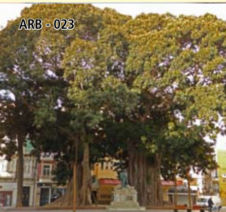
ARB - 023