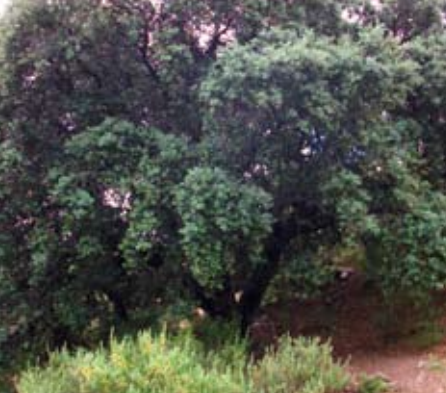
ARB - 036