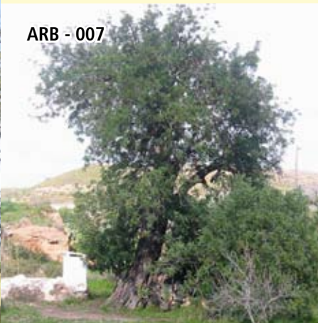
ARB - 007