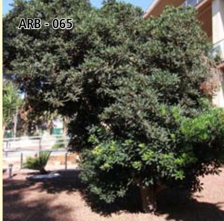
ARB - 065