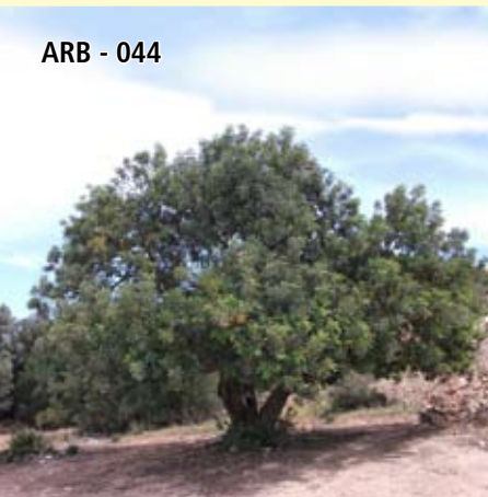
ARB - 044