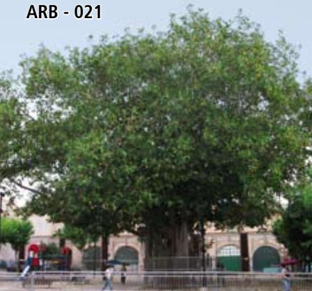
ARB - 021