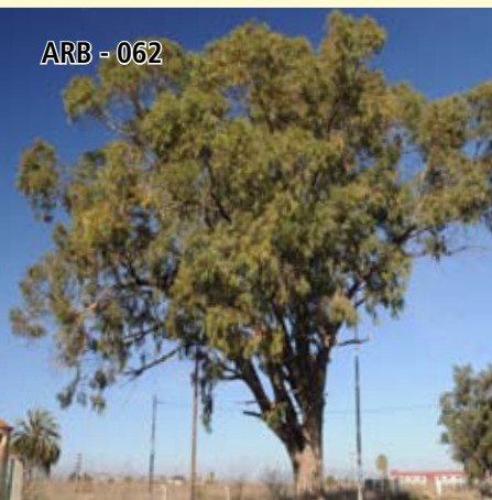
ARB - 062