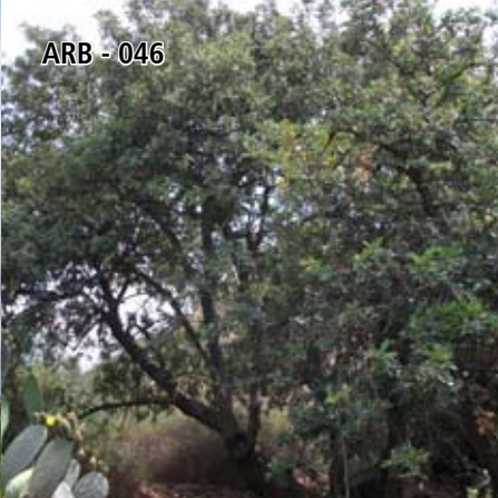
ARB - 046