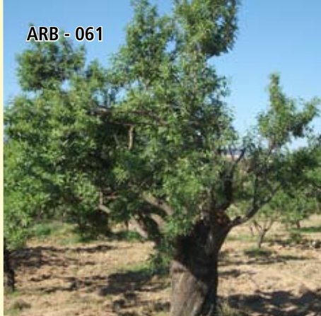
ARB - 061