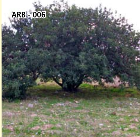
ARB - 006