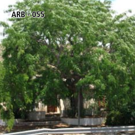
ARB - 055