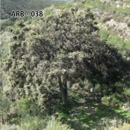
ARB - 038